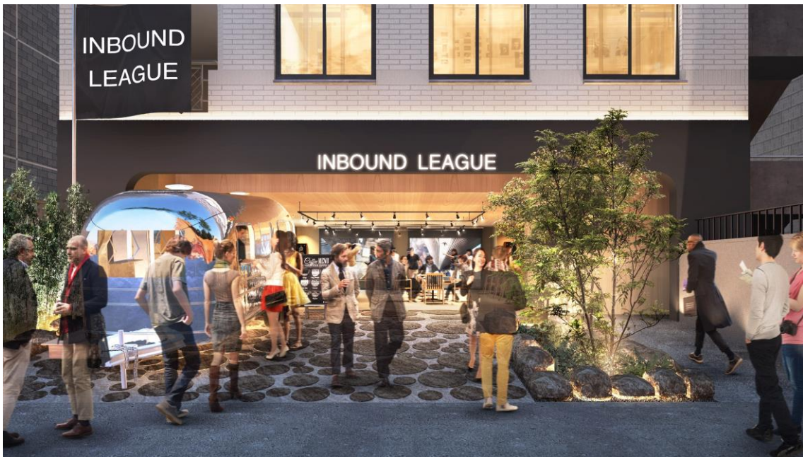
INBOUND LEAGUE エントランスイメージ